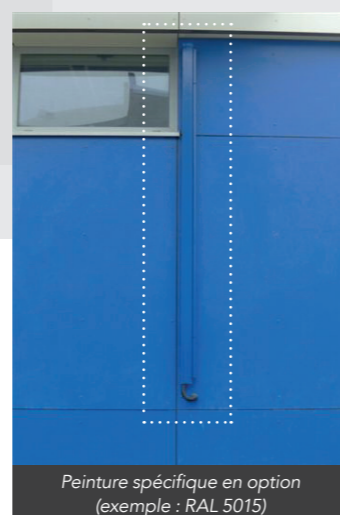
Peinture spécifique en option (exemple : RAL 5015)